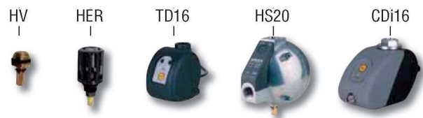
SCARICATORI DI CONDENSA/CONDENSATE DRAINS